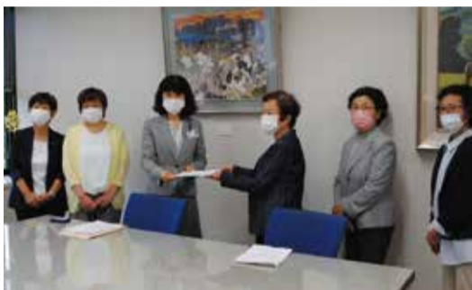
新日本婦人の会のみなさんが「生理の貧困」対策を県に申し入れ(5/27荻野佳子県教育長に要望書を提出)

6月17日に富山市内の学校・保育施設で発生した食中毒。1200人以上に症状があり、市内業者が製造した牛乳が原因とされました。原因菌は特定されていないものの、その後の業者への立ち入り調査では、タンクなどの汚れや大腸菌群が確認されました。富山保健所による年2回の定期検査では、把握していません