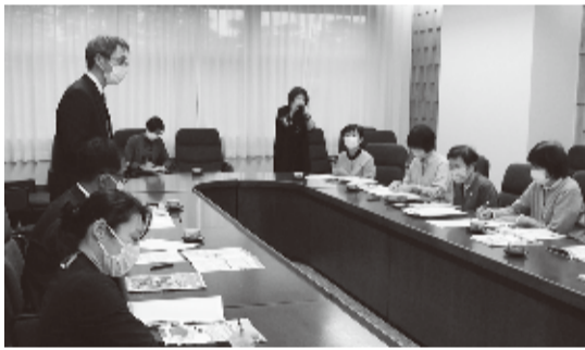
11/29 新日本婦人の会のみなさんが、ライフプランガイドの改善を県教育委員会に要望

参加者からは「10〜20才代の出産を奨励しているかのよう」「男女の制服姿しか登場せず、性的少数者への配慮がない」「女性が主に家事を担う家