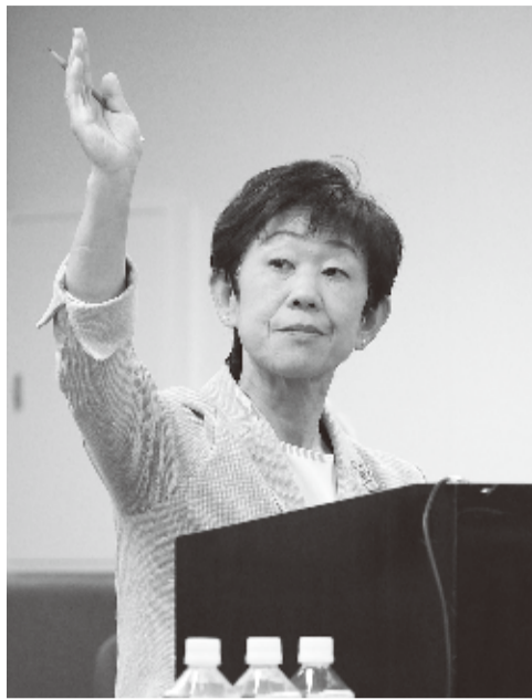
3/8 予算特別委員会で

ひづめ県議は質問で、岸田内閣の「安保3文書」の危険性、ジェンダー平等と教育、PFI手法の問題点などについても取り上げました。