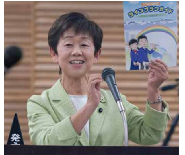
3/8 予算特別委員会で

北陸電力が、電気料金の45・8%値上げを国に申請しています。値上げ幅は、大手電力7社で最大です。今年1月には、オール電化の家庭を中心に、自由料金を大幅に値上げしたばかりです。